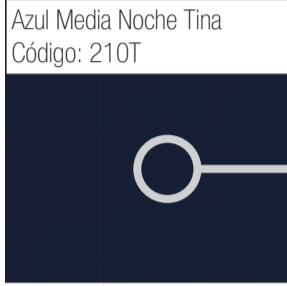
Azul Media Noche Tina Código: 210T

Tela construida con sarga reforzada con tejido denso. Elaborada de 100% algodón. Se puede desarrollar colores especiales bajo pedido.